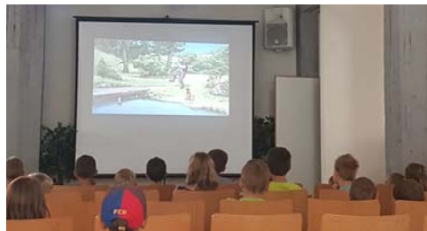
Allianz – Filmtag "Kuddelmuddel bei Peterson & Findus"