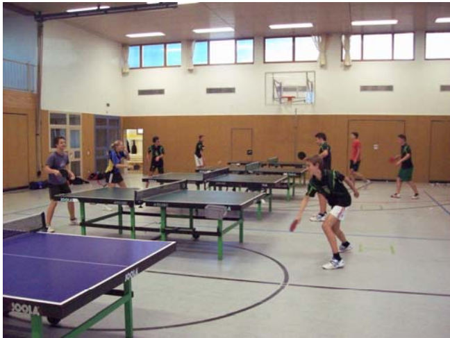
SpVgg/DJK Wolframs-Eschenbach, Sparte Tischtennis