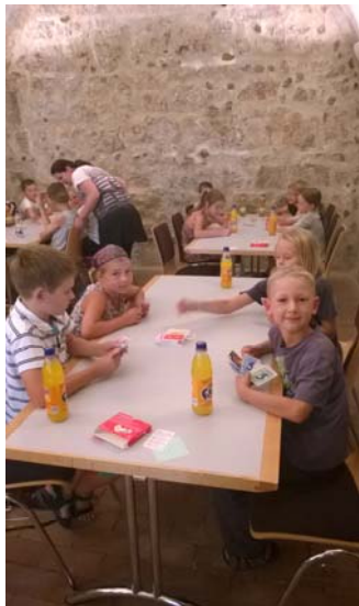
CSU-Ortsverband – Uno Turnier